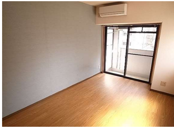
※部屋の写真は反転タイプです。 ※現物優先と致します。